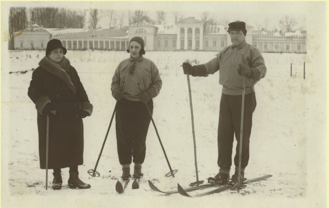
Późnoklasycystyczna rezydencja z początku XIX wieku Rdułtowskich, następnie Harthingów w Snowiu, majątku i miasteczku między Baranowiczami a Nieświeżem. W latach 30. siedziba batalionu i pułku Korpusu Ochrony Pogranicza „Snów”. Fotografia z lat 30. ze zbiorów Tomusza Kuby Kozłowskiego