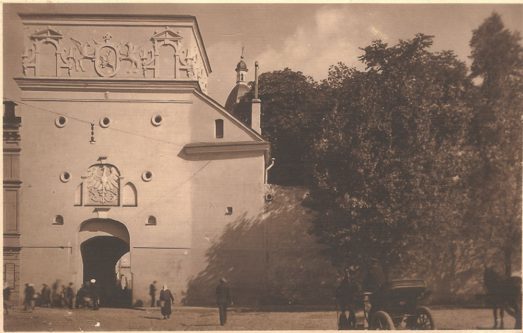
Widok na Ostrą Bramę od strony ulicy Bazyliańskiej. Nad wejściem w 1923 roku umieszczono godło Polski autorstwa rzeźbiarza Bolesława Bałzukiewicza, profesora Wydziału Sztuk Pięknych Uniwersytetu Stefana Batorego w Wilnie. Dziś w tym miejscu znajduje się wizerunek Chrystusa. Fotopocztówka Edmunda i Bolesławy Zdanowskich wydana przed 1939 r. Ze zbiorów Przemysława Namsolka