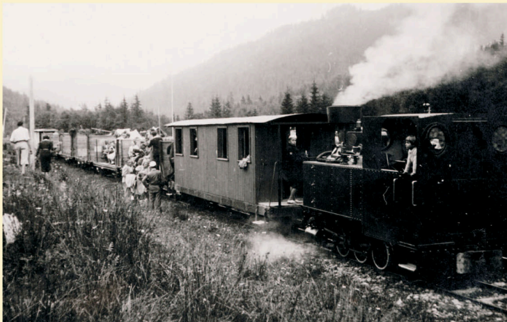
W góry! W góry miły bracie! Tam swoboda czeka na cię – pisał w „Pieśni o ziemi naszej” Wincenty Pol (1807-1872) poeta, geograf, który pierwszy użył słowa Kresy w rapsodzie rycerskim „Mohort” w 1854 roku. Na fotografii z lat 30. XX wieku kolej wąskotorowa z Worochty pod Howerłą (2055 m n.p.m.), najwyższy szczyt Beskidów Wschodnich w północno-zachodniej części pasma Czarnohory.