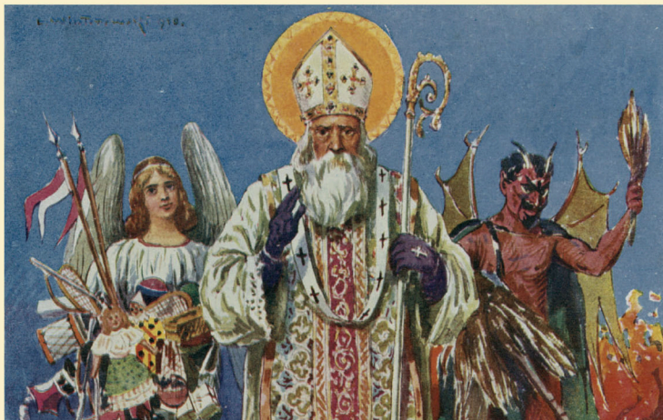
Świętemu Mikołajowi, wdrążącemu po Kresach 6 grudnia, towarzyszyły zazwyczaj postaci anioła i diabła. Pierwszy miał w zanadrzu prezenty dla grzecznych dzieci, drugi - różgi dla tych niegrzecznych... Poetówka wydana w 1910 roku w Lwowie, według projektu malarza Leonarda Winterowskiego, Ze zbiorów Tomasza Kuby Kozłowskiego