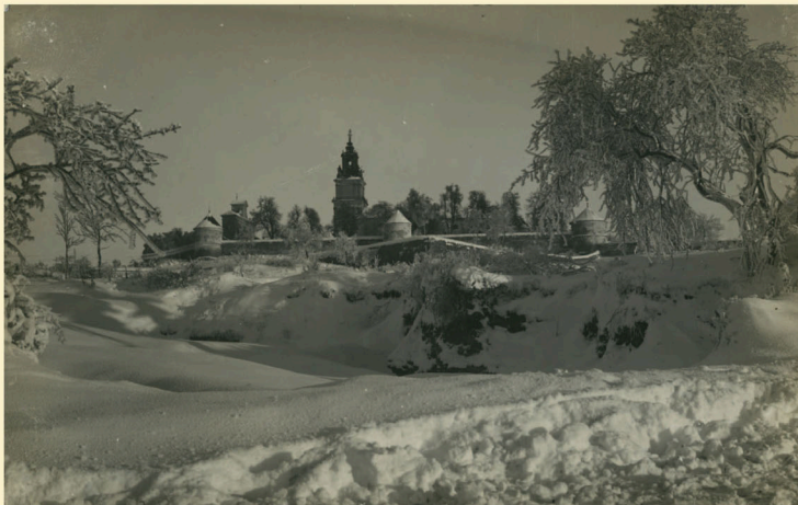
Widok klasztoru oo. Dominikanów w Podkamieniu i kościoła pw. Wniebowzięcia Najświętszej Panny Marii w województwie tarnopolskim, w którym znajdował się słynący cudami obraz Matki Bożej (obecnie we Wrocławiu). Fotografia z lat 20. lub 30. XX wieku