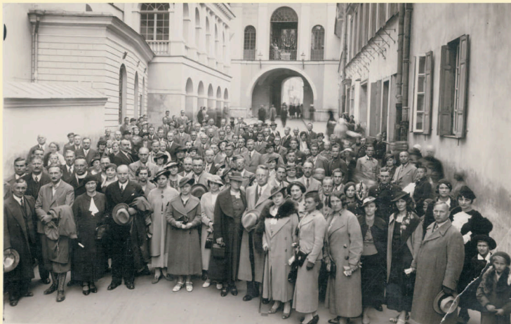
Panno Święta, co Jasnej bronisz Częstochowy i w Ostrej święcisz Bramie! – któż z nas nie zna tych słów z Inwokacji „Pana Tadeusza”. 16 listopada obchodzimy Święto Matki Boskiej Ostrobramskiej – Matki Bożej Miłosierdzia. Kult, słynący łaskami, wileńskiego wizerunku trwa od XVII wieku do dzisiaj. Na fotografii z lat 30. XX wieku wycieczka nowogródzcan do Wilna.